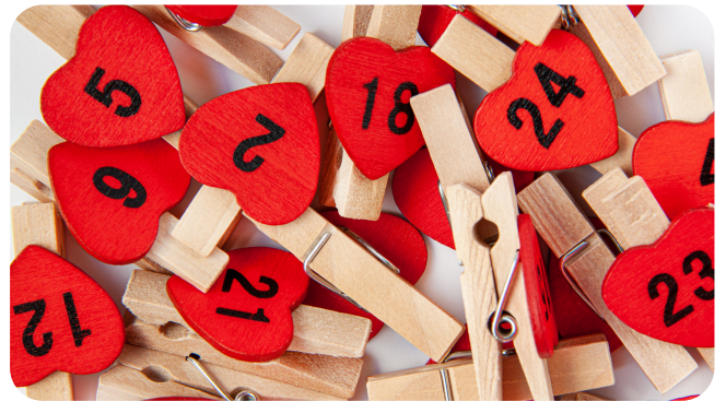
Faire son propre calendrier de l'avent écolo

Emballage sans papier avec la méthode Furoshiki