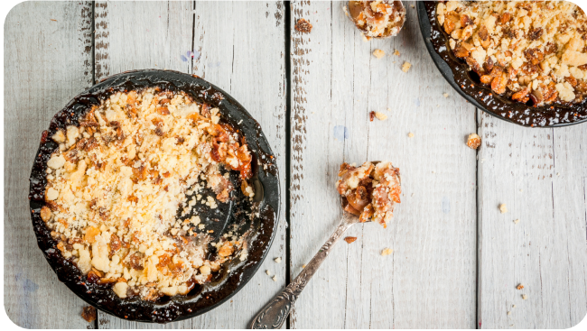
Carnet de recettes pour les fêtes de fin d'année