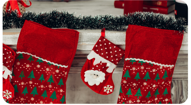
Faire ses propres décorations de Noël DIY