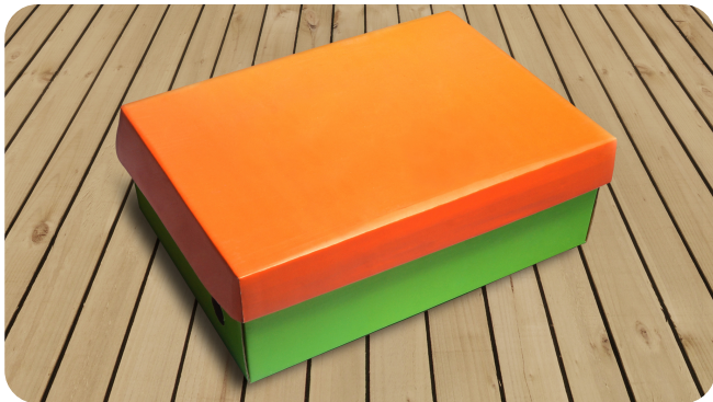
DIY jouets pour enfants avec une boîte à chaussures